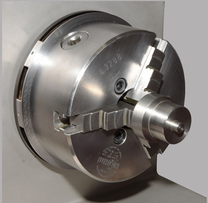
MPM-Auswuchtring mit Wuchtsegmenten: 3.WRS.xxx Patentiert

Unruhiger Lauf, niedrige Drehzahlen und schlechte Oberflachen durch exzentrische, unwuchtige Werkstucke?